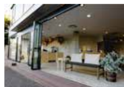
岡山神社隣接のカフェ↑

私たちはグラスワインとキッシュを販売し ます。他店舗さんは、コーヒーやケーキ、 シチュー、ホットドック、酵素玄米茶漬、 フルーツサンドや豆腐ドーナツなど!